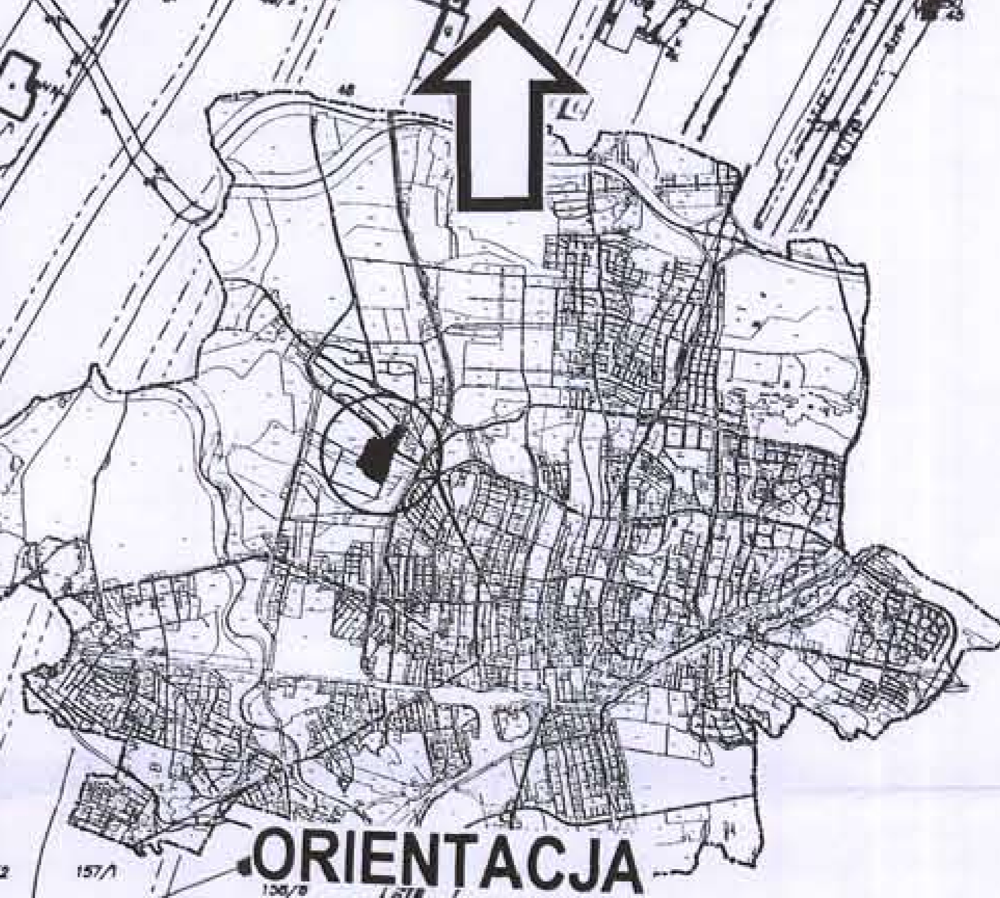
WYRYS ZE STUDIUM UWARUNKOWAŃ I KIERUNKÓW ZAGOSPODAROWANIA PRZESTRZENNEGO GMINY MIASTA TARNOWA skala 1 : 10000